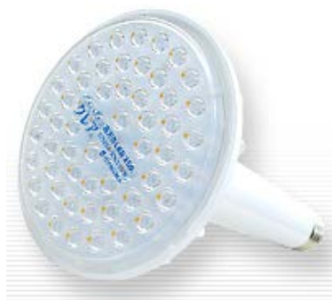
高天井LED 250 【250W水銀灯相当】 50W 5500lm 650g