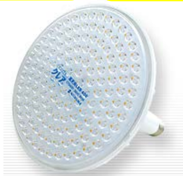
高天井LED 400 【400W水銀灯相当】 90W 10800lm 1200g