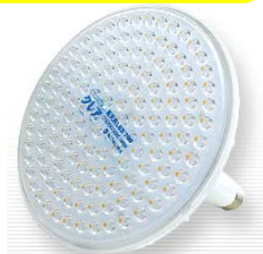
高天井LED 700 【700W水銀灯相当】 140W 14800lm 1800g